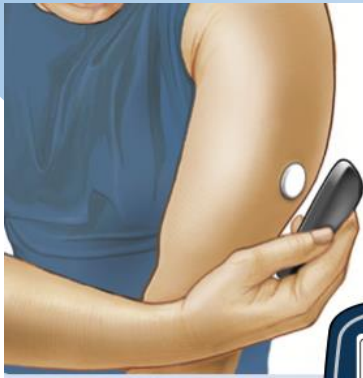
センサー（サイズ：500円玉程度）